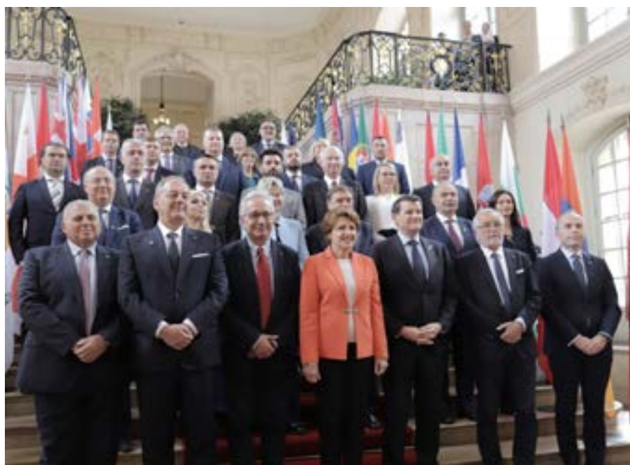
Účastníci zasedání OIV v Dijonu v neděli 13. 10. 2024

Ministři jednomyslně uznali potřebu udržitelnosti pro víno, hrozny a produkty z révy vinné – z hlediska životního